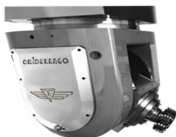
Cabezal Continuo Universal Horquilla