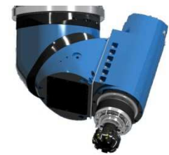
Cabezal Continuo Universal 45º