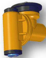
Cabezal Continuo Universal Ortogonal