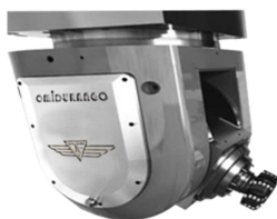
Cabezal Continuo Universal Horquilla