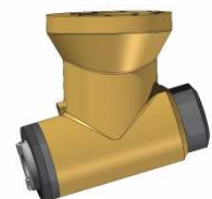
Cabezal Semi-Universal Angular